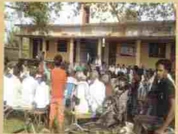
सम्मेलनको उद्घाटन समारोह