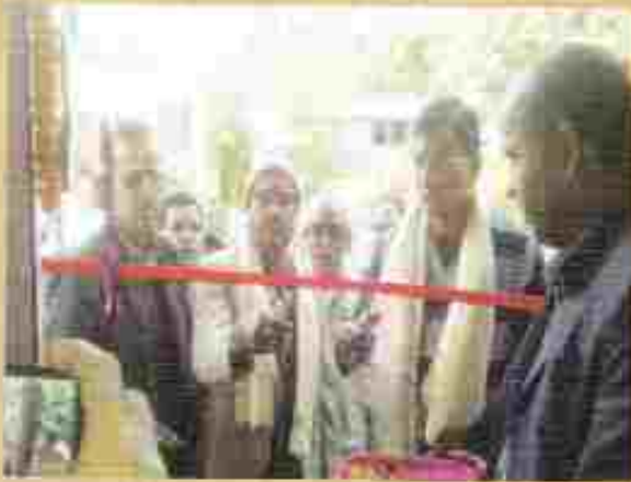
सम्मेलनको उद्घाटन समारोह