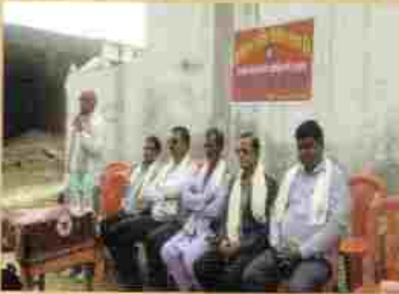
सम्मेलनको उद्घाटन समारोह